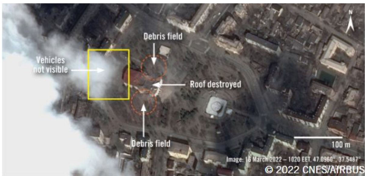
Satellite image from 16 March shows damage to the theatre, shortly after the strike.

در روزهای پس از حمله هوایی، نیروهای روسی کنترل مرکز شهر را به دست گرفتند. تئاتر با بولدوزر تخریب شد و بقایای آن به گورهای دسته جمعی در حال رشد در ماریوپل و اطراف آن برده شد.