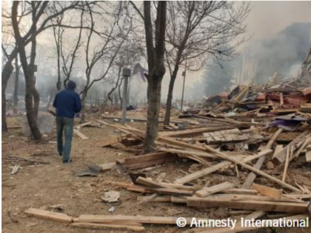
Debris strewn to the side of the theatre, shortly after the attack.

گزارش روز پنجشنبه به نقل از برخی شاهدان که معتقد بودند ساختمان به دلیل تخلیه در دو روز قبل تخلیه شده است، نشان می دهد که تلفات به اندازه آمار ذکر شده توسط AP یا شهر نیست.