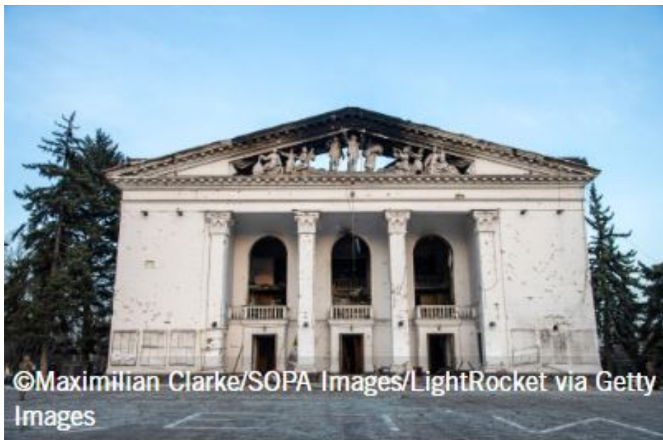
The damaged Drama Theatre in Mariupol, with the word 'children' clearly written in the foreground.

شد. عفو بین‌الملل گفت هیچ مدرکی وجود ندارد که نشان دهد تئاتر منطقه‌ای درام آکادمیک دونتسک پایگاه عملیاتی برای سربازان اوکراینی بوده و هر نشانه‌ای وجود دارد که نشان می‌دهد این تئاتر پناهگاهی برای غیرنظامیانی بوده است که به دنبال محافظت در برابر هفته‌ها بمباران و حملات هوایی برآمان بودند.