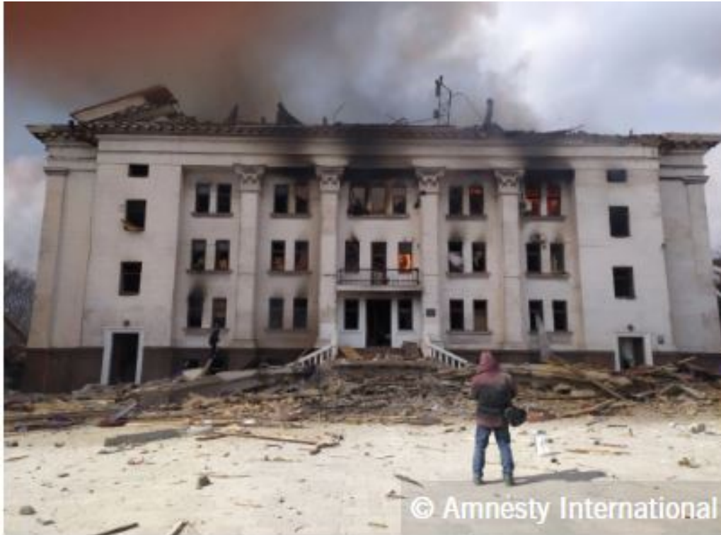
The damaged rear of the theatre, moments after the explosion.

محققان عفو بین الملل هویت 12 نفر از کشته شدگان را شناسایی کردند.